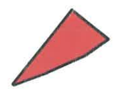
AMPLASAMENT PUZ STUDIAT