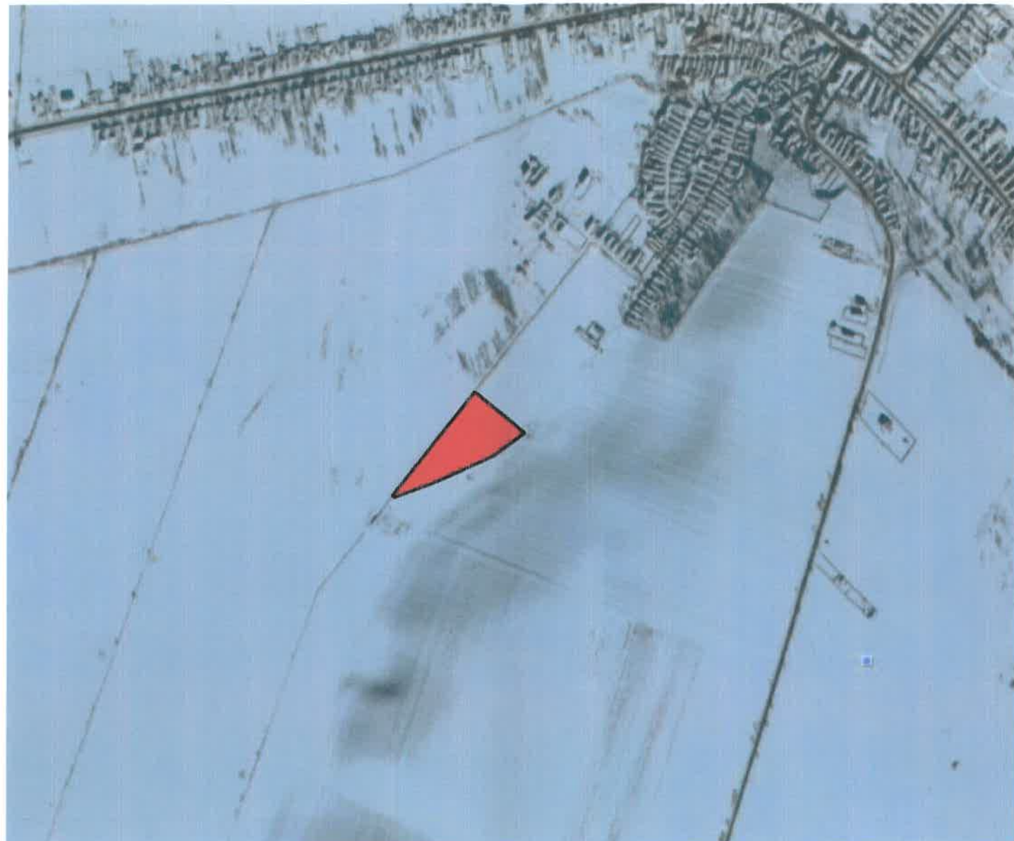
PLAN DE ORIENTARE